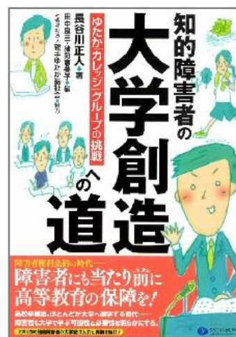
「カレッジ」の取り組みは単行本としてまとめられた

2015年10月『知的障害者の大学創造への道』を出版しました。カレッジでの学生の様子や取り組みの詳細、青年期の発達の視点から見た学ぶことの意義、海外の状況などについて言及しています。是非ご一読ください。