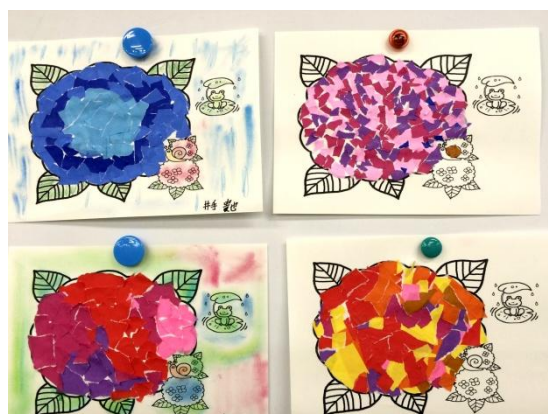
「文化・芸術」の授業－色(グランデーション)の学習