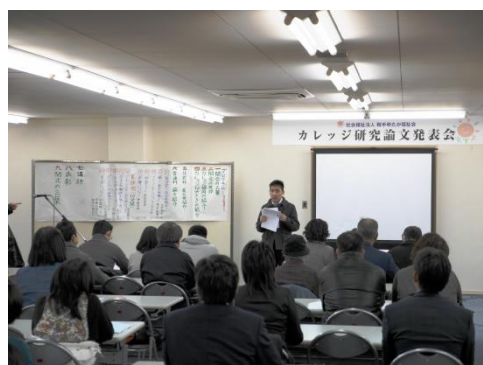
年度末には研究論文を発表—大勢の観客の前で堂々と発表

ッジ交流会が行われ、普段会うことのない他カレッジの学生との交流を深めます。学生たちは、同じ思いで頑張っているのは自分たちだけではないのだということを実感し、その