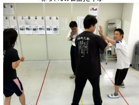
「スポーツ」の授業－護身術を学ぶ