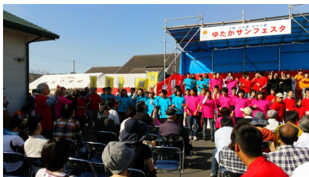
ゆたかサンフェスタ