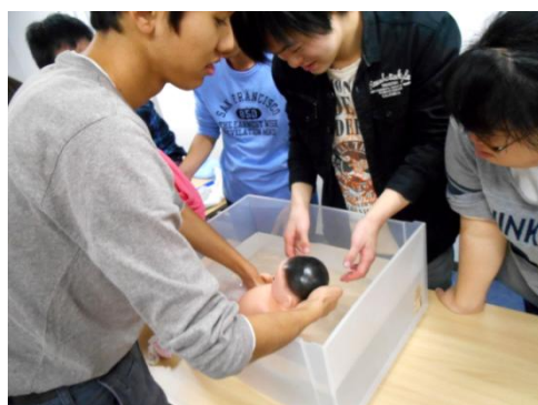
「ヘルスケア」の授業一心と体の学習講座 「赤ちゃんの世話」を学ぶ