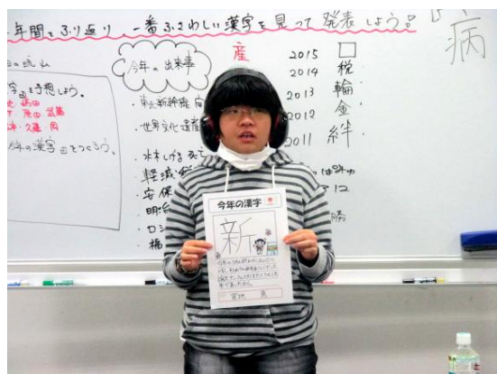
「基礎学力」の授業－私にとっての今年の漢字