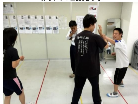
「スポーツ」の授業－護身術を学ぶ