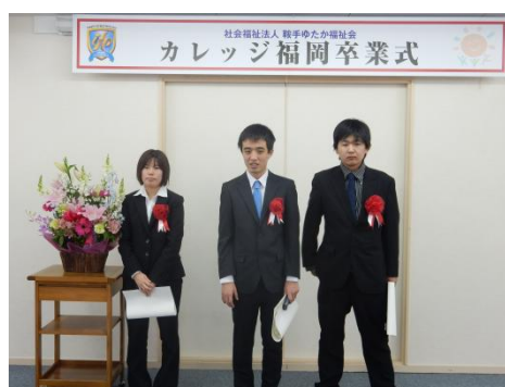
カレッジ福岡第1期卒業生

カレッジ福岡は、法制度上は障害者総合支援法にもとづく自立訓練（生活訓練）事業と就労移行支援事業を組み合わせた多機能型事業所です。福祉サービスを大学に見立てたものであるため、私たちはこれを「福祉型大学」と呼んでいます。修業年限を4年間とし、前半2年間の自立訓練事業を「教養課程」、後半2年間の就労移行支援事業を「専門課程」と位置づけています。そこでは利用者を「学生」、支援員を「支援教員」、訓練室を「教室」と呼んでいます。また学生個々人の障害特性に対応した支援と、豊かな学びを提供する教育の双方を大切にしたい取り組みをめざしているため、私たちはその実践を「支援教育」と呼んでいます。